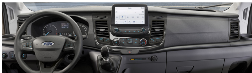
Mais conforto e dirigibilidade em conjunto com o Sync Move e a direção elétrica.