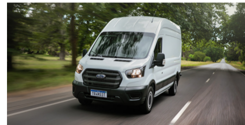
Pacote AdvanceTrac® que entrega mais segurança para o condutor.