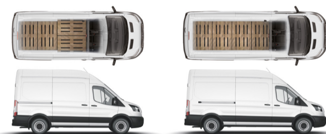
L2H3 Furgão com capacidade volumétrica de carga de 10,7m³ e categoria "B" de habilitação.