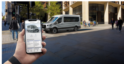
Controle total da sua Transit e do seu negócio na palma da sua mão, com FordPass™ você localiza o seu veículo em tempo real, tem informações sobre a saúde do carro e ainda realiza controles remotos, como travar e destravar o carro.