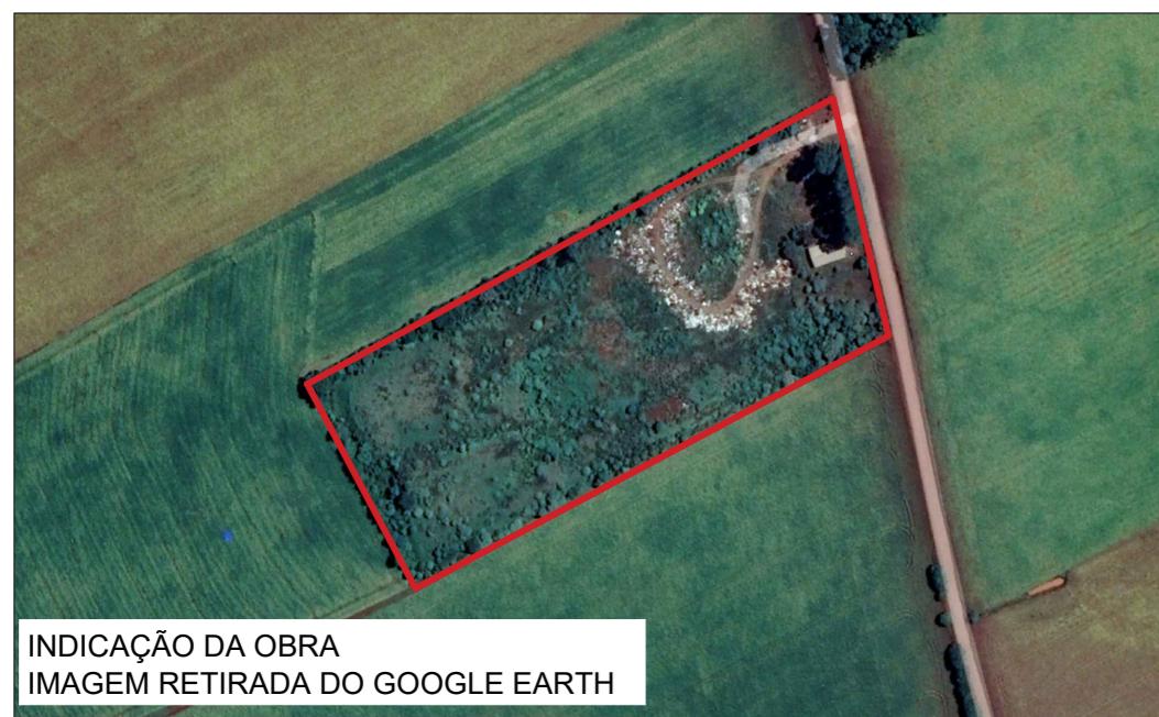
INDICAÇÃO DA OBRA